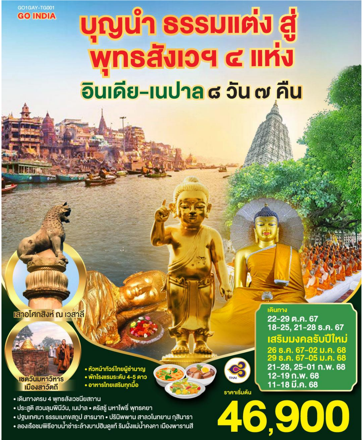
เสาอโศกสิงห์ ณ เวสาลี