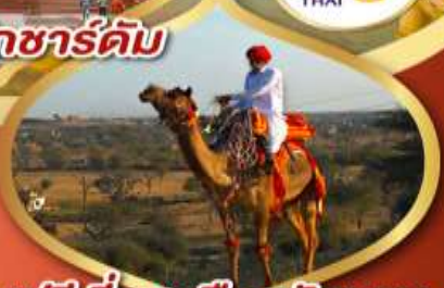
ฟรี ژیออู เมืองมันทอวา ราคาเริ่มต้น