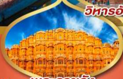
พระราชวัง สายลม