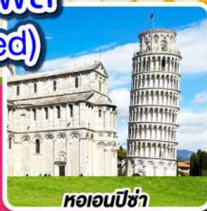
หออนปิซ่า