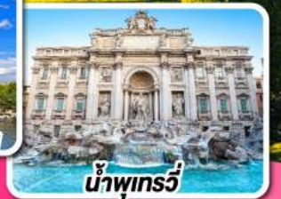
น้ำพุทรวี่