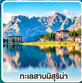
ทะเลสาบมิสุรีน่า