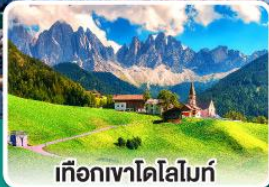
เทือกเขาโดโลไมท์