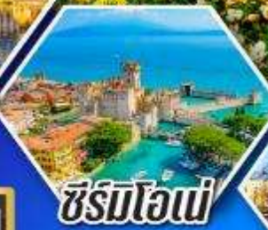
ซีร์มิโอนี