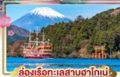
ล่องเรือทะเลสาบฮาโกเน่