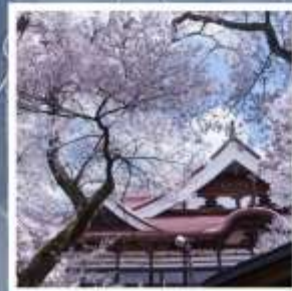
สวนสาธารณะซากุระปราสาทคาเคียว