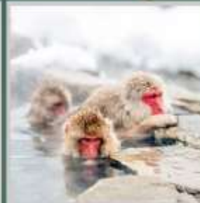
"SNOW MONKEY PARK"