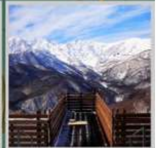
"HAKUBA MOUNTAIN HARBOR"