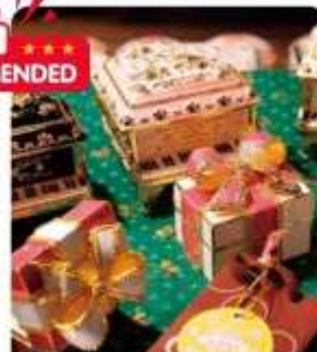
กล่องดนตรี MUSIC BOX

ร้านนี้สัทกับแสนอร่อย ด้วยเบรธมากมายทั้งข้าวตอกแฉ่ำด้วยมิโที่รสอบจูน ช็อกล่อด้วยแฉ่ำและซากแบบมิวสิกบ็อกซ์