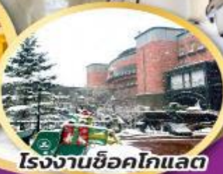
โรงงานช็อคโกแลต