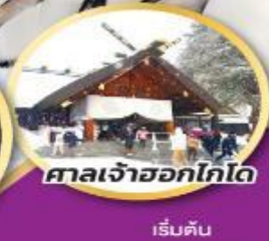
ศาลเจ้าออกโทโด