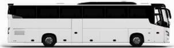
ตัวอย่างรถทัวร์ 1 คัน

ค่าที่พักตามที่ระบุในรายการหรือเทียบเท่าระดับเดียวกัน (พิกห้องละ 2 ท่าน) หากประเภทห้องที่ท่านริเวสมาเป็นเตียงเดี่ยว เช่น ริเวสห้องพักเป็น TWIN BED หรือ DOUBLE BED ทางบริษัทขอสงวนสิทธิ์ในการปรับประเภทห้องพัก เป็นตามที่โรงแรมมีอยู่ โดยไม่ต้องแจ้งให้ทราบล่วงหน้า