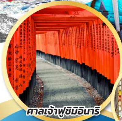
ศาลเจ้าฟูชิมิอินาริ