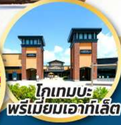
โทเทมบะ พรีเมียมเอาท์เล็ต