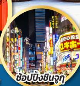
ช้อปปิ้งชินจูกุ