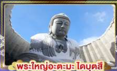
พระใหญ่อะตะมะโดบุตสึ