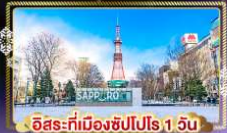
อิสระที่เมืองซัปโปโร 1 วัน