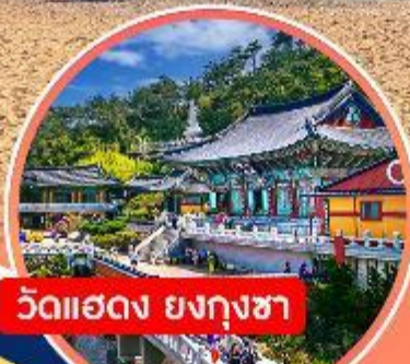
วัดแฮดง ยงกุงซา