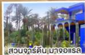
สวนจาร์ดิน|มาจออเรล