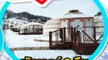
พักเกอร์ 2 คืน (มีห้องน้ำในตัว)