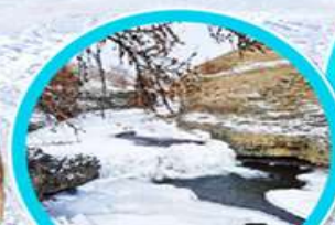
เดินเล่นบนธารน้ำแข็ง Orkhon river