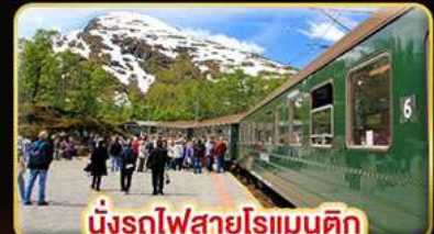
นั่งรถไฟสายโรแมนติก “พร้อมสปาเนา”