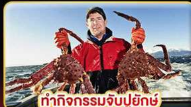
ทำกิจกรรมจับปูยักษ์ “พร้อมเมนูสุดพิเศษ”