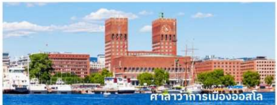
ศาลาว่าการเมืองออสโล