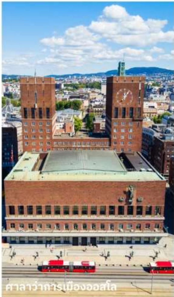
ศาลาว่าการเมืองออสโล