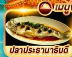
ปลาประจักษ์