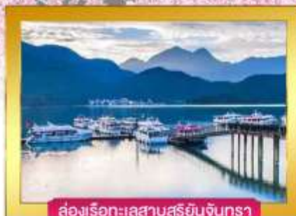
ล่องเรือทะเลสาบสุริยันจันทรา