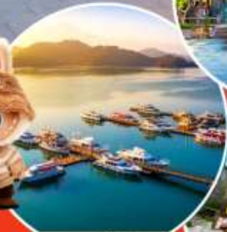
ทะเลสาบสุริยอินจินทรา