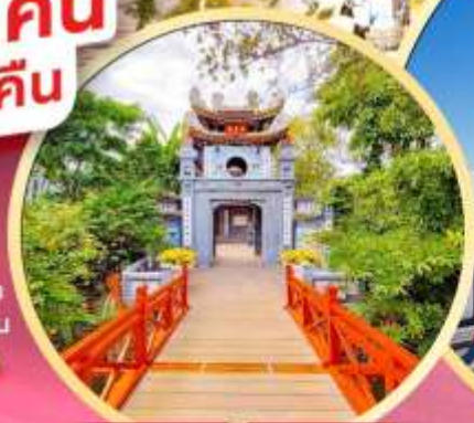
วัดห็อกเซิน