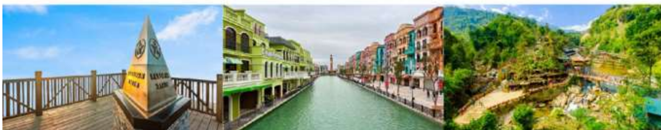
ยอดเขาฟานซิปิน