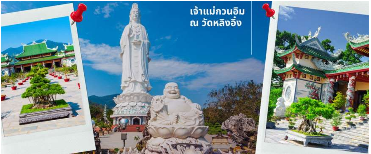
เจ้าแม่กวนอิม ณ วัดหลิงอิ่ง

เพื่อเป็นการปกป้องคุ้มครองชาวประมงที่ออกไปหาปลา เสียงระฆังวัดที่ตีประสานกับเสียงคลื่นนั้นช่วยให้ชาวเรือรู้สึกสงบ