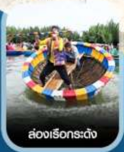
ล่องเรือกระดัง

คอนเฟิร์ม ออกเดินทาง ทุกพีเรียด 2 ท่านขึ้นไป