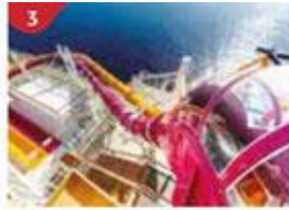
3 Waterslide Park Get drenched in fun on one of our six different waterslides.