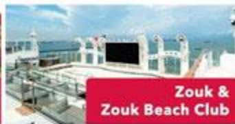
Zouk & Zouk Beach Club