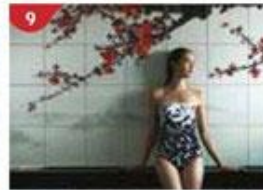
9 Crystal Life™ Spa Rejuvenate mind, body and soul with our holistic Western and Asian spa experience.