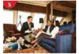
5 The Palace Indulge in European-style butler service and exclusive facilities.