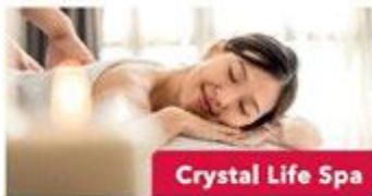
Crystal Life Spa