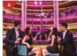
4 Bar 360 Catch live music and aerial acrobatic performances with a glass of champagne.