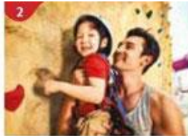
2 Rock Climbing Wall Challenge yourself on our mountainous rock climbing wall.