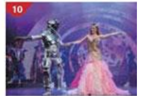
10 Zodiac Theatre Enjoy live production shows from the acclaimed award-winning entertainment team.