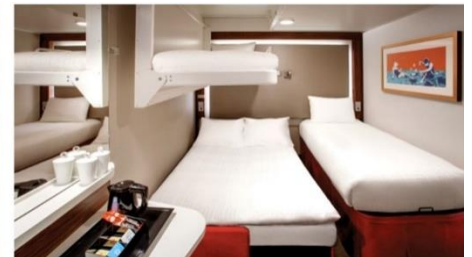
พัก 3-4 ท่าน