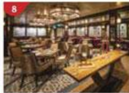
8 Bistro By Mark Best Relish contemporary Western cuisine from the internationally-acclaimed Australian chef.