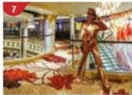
7 Johnnie Walker House™ Immerse yourself in the intricate world of premium Scotch whisky.