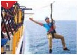
1 Ropes Course & Zipline Feel the thrill of gliding above the ocean on a 35-metre zipline.

ถ้าท่านประสงค์จะถือกระเป๋าเดินทางลงด้วยตัวเองไม่จำเป็นต้องวางไว้ที่หน้าห้องพัก