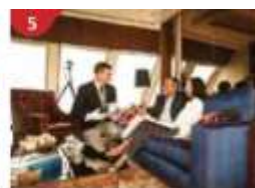
5 The Palace Indulge in European-style butler service and exclusive facilities.