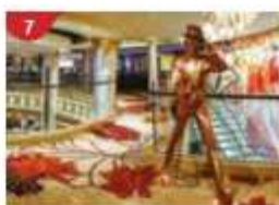
7 Johnnie Walker House™ Immerse yourself in the intricate world of premium Scotch whisky.