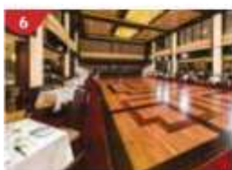
6 Dream Dining Room Savour a wide variety of Asian and international cuisine.