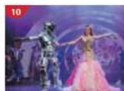
10 Zodiac Theatre Enjoy live production shows from the acclaimed award-winning entertainment team.

**เรือจะมีใบแจ้งสถานที่และเวลาที่ห้องพักของท่านเพื่อนให้ท่านรับหนังสือเดินทางคืน