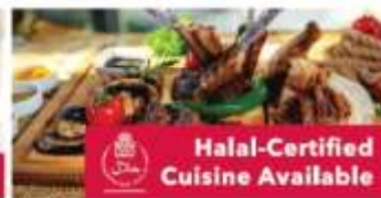
Halal-Certified Cuisine Available