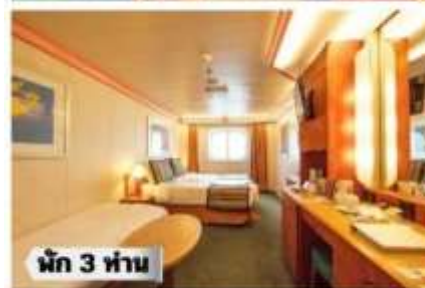
น้ก 3 ท่าน

OP-Oceanview Premium >> ชั้น 1 กลางเรือ, ชั้น 2 ห้องชั้น ,ชั้น 6-7-9-10 ไว้คบังคับ