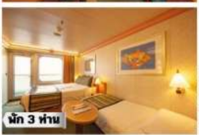
น้ก 3 ท่าน

BP-Balcony Premium >> ชั้น 6 กลางเรือ, ชั้น 7 หัวท้ายและท้ายเรือ, ชั้น 8-9