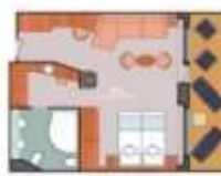
Floor Diagram Grand Suite Sleeps up to 4 10 Cabins Cabin: 498 sqft (46 m 2 ) * Size may vary, see details below.