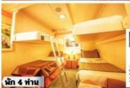
น้ก 4 ท่าน

ห้องพรีเมียมจะมี Location ดีกว่า เช่น ชั้นสูงกว่าห้องคลาสสิก และ สามารถ เลือกขอบ อาหารสำร็จ