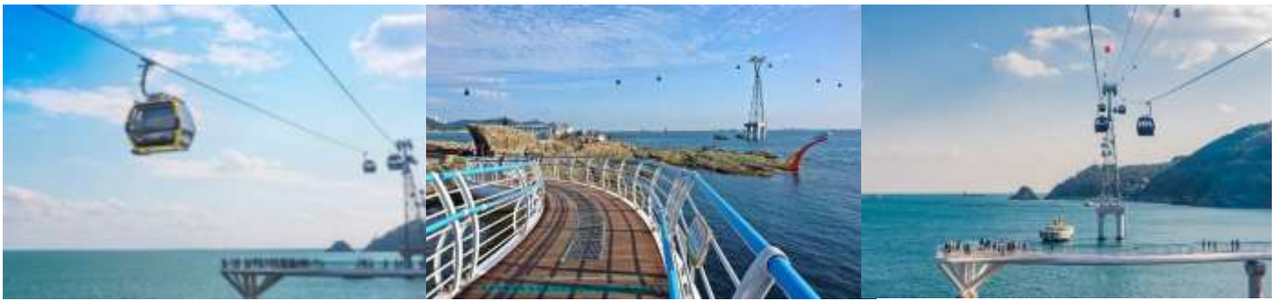
Songdo Yonggung Suspension Bridge