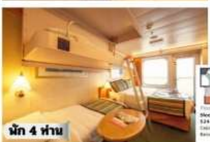
น้ก 4 ท่าน

ห้องพรีเมียมจะมี Location ดีกว่า เช่น ชั้นสูงกว่าห้องคลาสสิก และ สามารถ เลือกขอบ อาหารสำร็จ