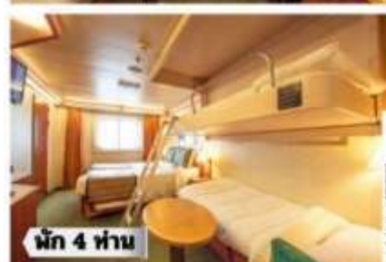
น้ก 4 ท่าน

ห้องพรีเมียมจะมี Location ดีกว่า เช่น ชั้นสูงกว่าห้องคลาสสิก และ สามารถ เลือกขอบ อาหารสำร็จ