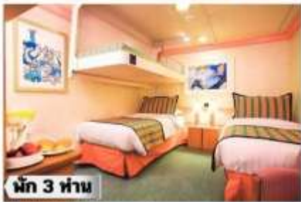
น้ก 3 ท่าน

IP-Inside Premium >> ชั้น 2 กลางเรือ และ ชั้น 6-10